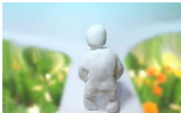
<迷っている社長へ>